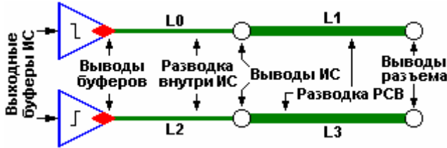
Рис. 2. Сумма (L0 + L1) должна равняться сумме (L2 + L3) в пределах допустимой погрешности

Рисунок 2 показывает, что общая длина шины должна быть продумана с точки зрения уменьшения разницы в длинах дифференциальных проводников.